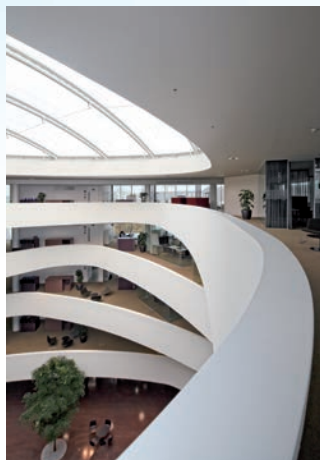
Innovation Headquarters in Linz