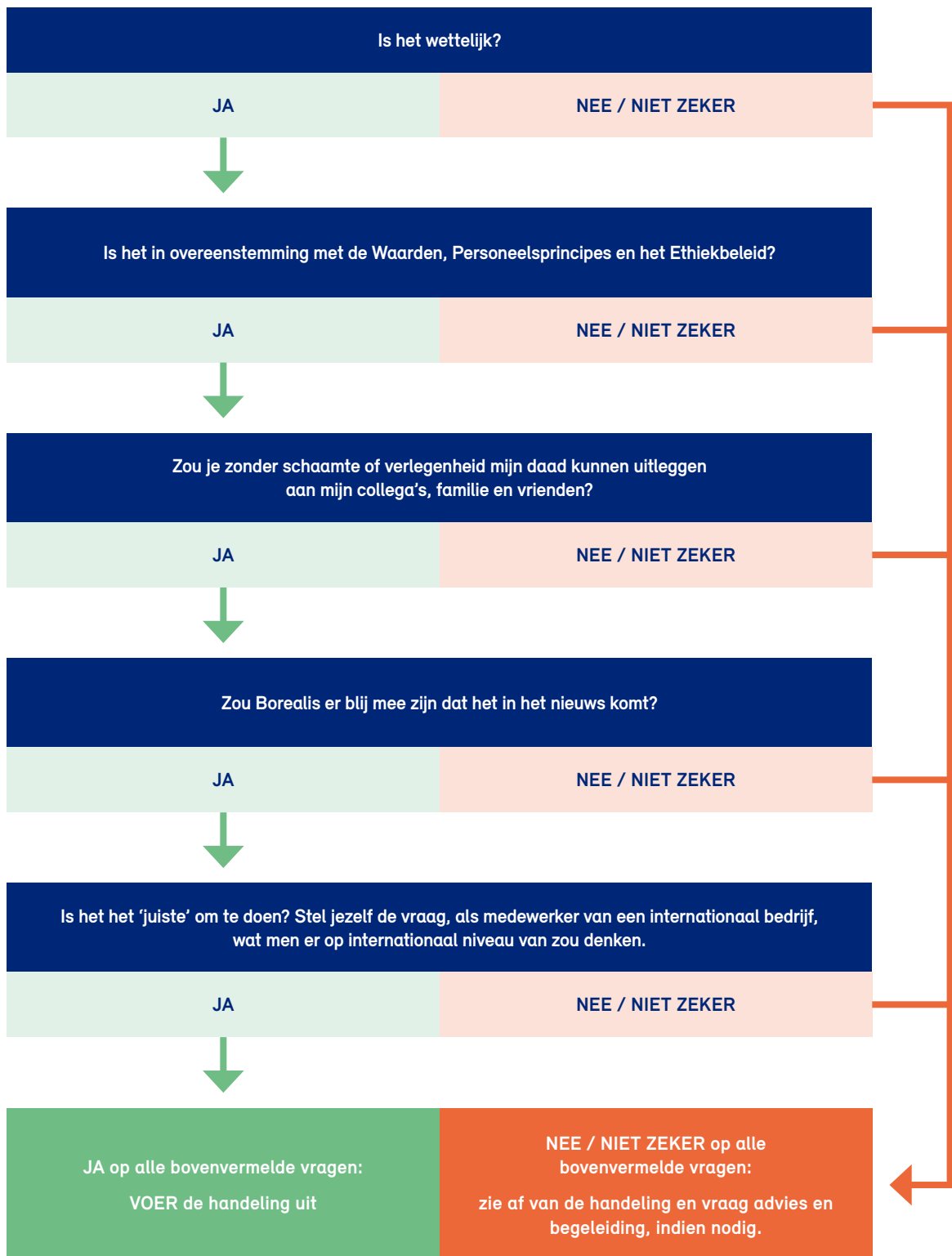
Fig. 2: Beslissingsboom