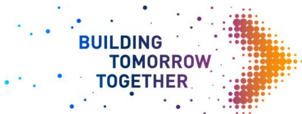
Abbildung: Borealis, Borouge und Nova Chemicals leben das Motto „Building Tomorrow Together“ auf der K 2019

Am 25. Juni 2019 wird ein gemeinsames Pre-K 2019 Kickoff-Event im Borealis Innovation Headquarters in Linz, Österreich, stattfinden. Borealis, Borouge und NOVA Chemicals werden dabei einen Ausblick auf ihre Themen und Aktivitäten im Rahmen der bevorstehenden K 2019, die im Oktober stattfindet, bieten. Zum ersten Mal steht bei dieser Veranstaltung ein Partner aus der Wertschöpfungskette an ihrer Seite: die EREMA Group, der globale Marktführer in der Entwicklung und Produktion von Kunststoffrecyclingsystemen.