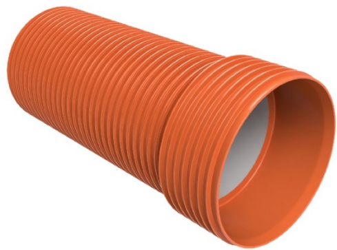
Kuva: Ultra Rib 2 Blue -putki.