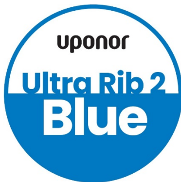
Kuva: Uponorin Ultra Rib 2 Blue logo.