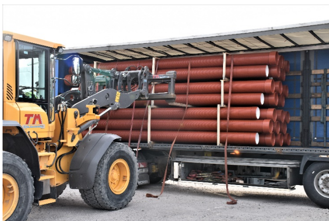
Kuva: Ensimmäinen Ultra Rib 2 Blue –putkitoimitus asiakkaalle Sigtunassa, Ruotsissa.