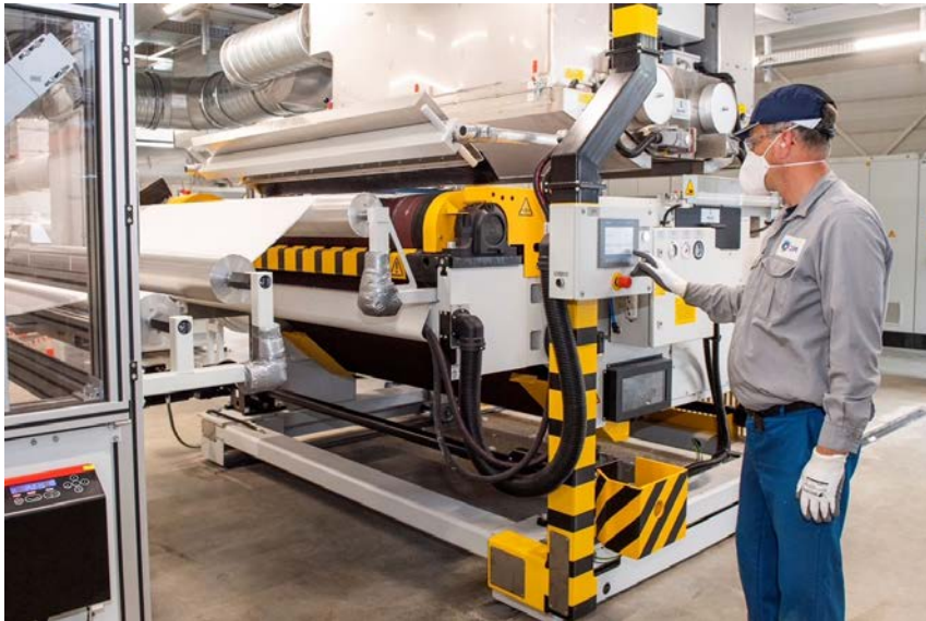
Foto: Dutch PPE Solutions produziert Meltblown-Filtermedien in den Niederlanden mit Polypropylen (PP) der Borealis Borneables™-Produktpalette.